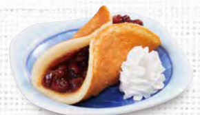
和風オムレット 250(税込275)