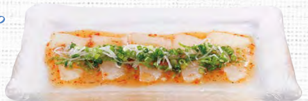
鯛のカルパッチョ 580 (税込638)

新鮮なお刺身を イタリアン風で。 お刺身で、 野菜を巻いて お召し上がり ください。