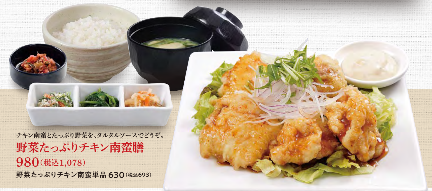
チキン南蛮とたっぷり野菜を、タルタルソースでどうぞ。 野菜たっぷりチキン南蛮膳 980(税込1,078) 野菜たっぷりチキン南蛮単品 630(税込693)