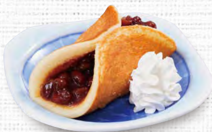
和風オムレット 250(税込275)