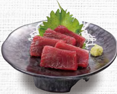
マグロの刺身 580 (税込638)