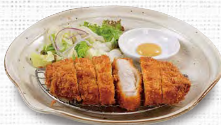
三元豚のロースカツ 1,030(税込1,133)