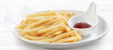
フライドポテト 280(税込308)