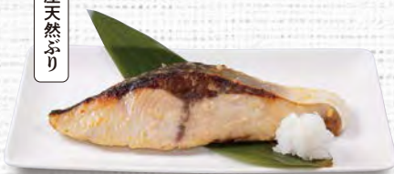
天然ぶりの西京みそ焼き 830(税込913)