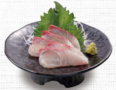
ヒラスの刺身 580 (税込638)