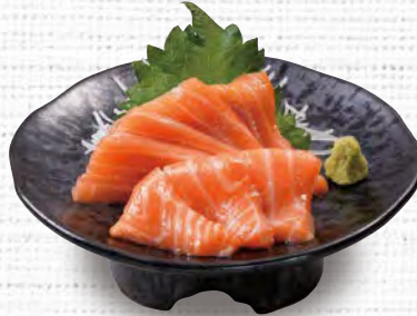
サーモンの刺身 580 (税込638)