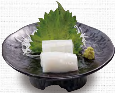
イカの刺身 480 (税込528)