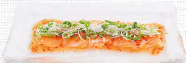
サーモンのカルパッチョ 530 (税込583)

新鮮なお刺身を イタリアン風で。 お刺身で、 野菜を巻いて お召し上がり ください。