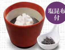
黒ごまプリン 280(税込308)