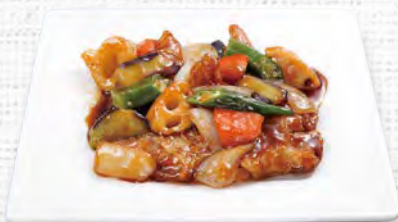
白身魚の黒酢炒め 630(税込693)