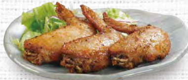
手羽先唐揚げ 480(税込528)