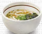
ミニうどん・ミニそば 各260(税込286)