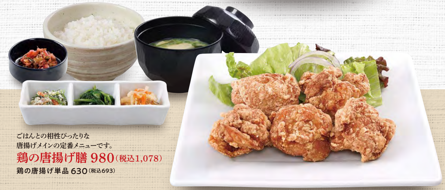
ごはんとの相性ぴったりな 唐揚げメインの定番メニューです。 鶏の唐揚げ膳 980(税込1,078) 鶏の唐揚げ単品 630(税込693)