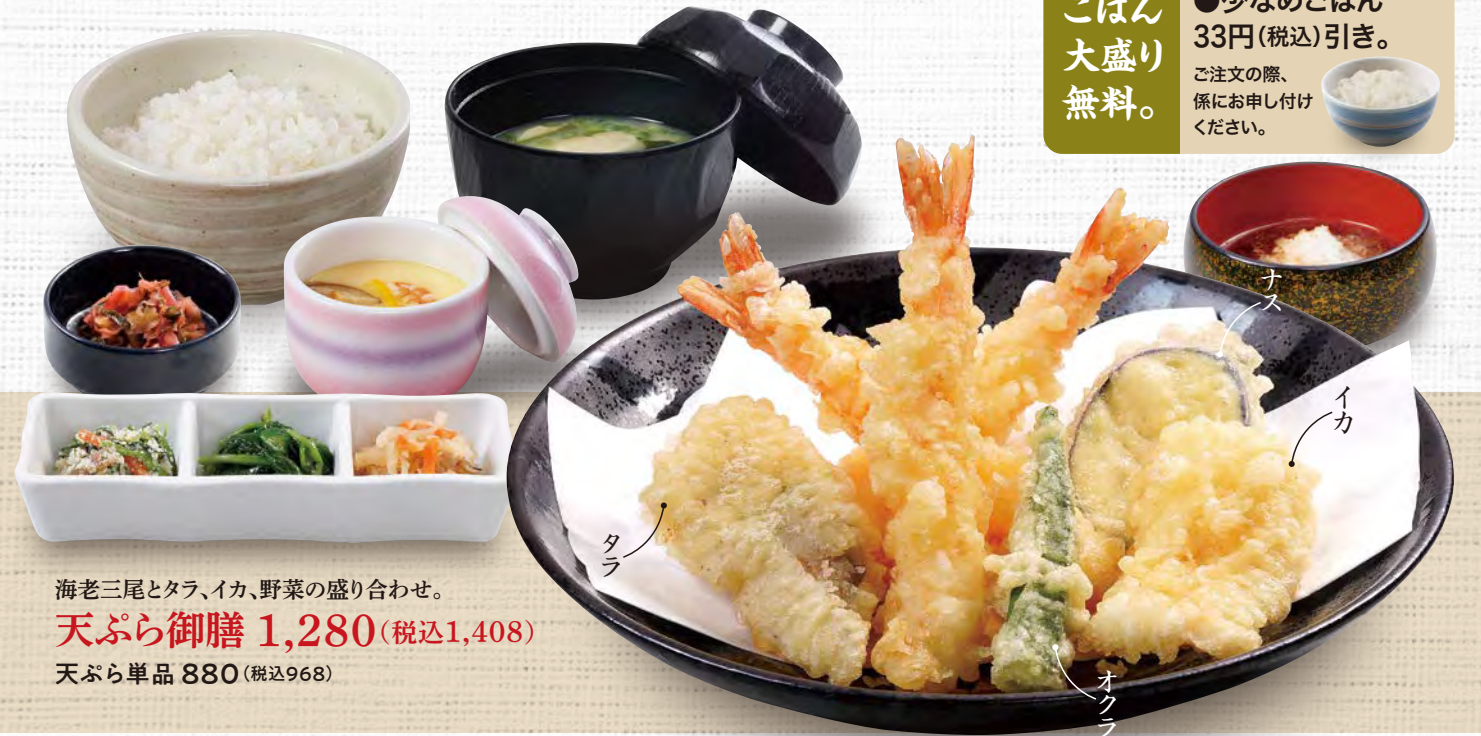
海老三尾とタラ、イカ、野菜の盛り合わせ。 天ぷら御膳 1,280(税込1,408) 天ぷら単品 880(税込968)