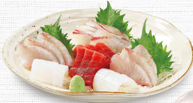
刺身特盛 2,180 (税込2,398)