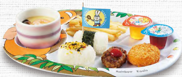
おこさまごぜん 580(税込638)