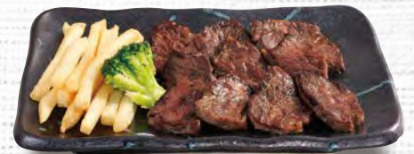
お箸ステーキ 830(税込913)