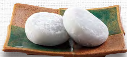
しっとりふわふわ大福 330(税込363)