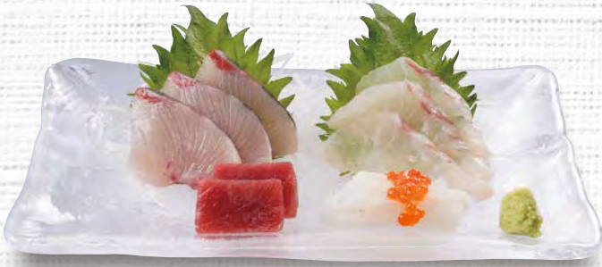
刺身盛り合わせ(松) 1,080 (税込1,188)