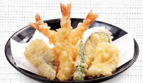
天ぷら盛り合わせ 880(税込968)