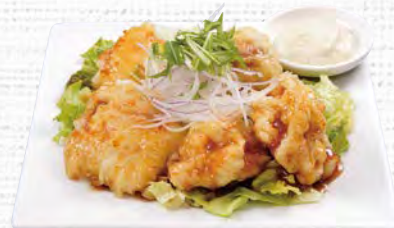
野菜たっぷりチキン南蛮 630(税込693)