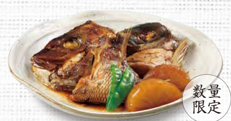
あら煮 980(税込1,078) ※魚種は仕入れ状況によりかわる場合がございます。