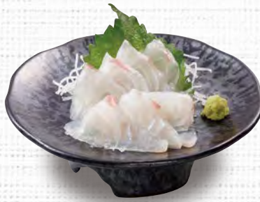
鯛の刺身 580 (税込638)