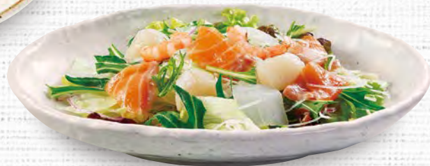
海鮮サラダ 630 (税込693)