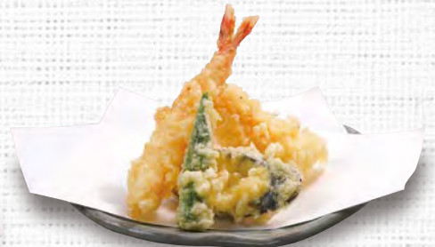
ちょっと天ぷら 380(税込418)