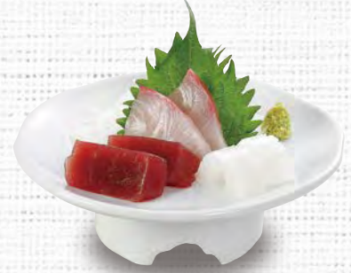
刺身盛り合わせ(竹) 580 (税込638)