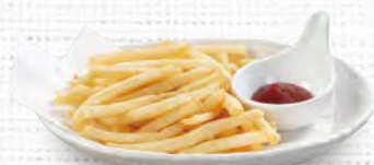
フライドポテト 280(税込308)