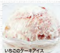
いちごのケーキアイス