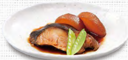
銀だらの煮付 880(税込968)