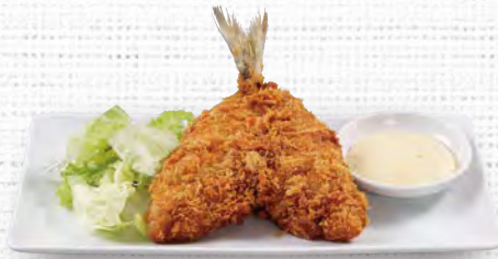
おつまみ あじ 鱈フライ 380(税込418)