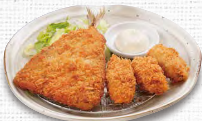
あじ鱈フライとカキフライ 930(税込1,023)