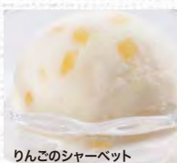
りんごのシャーベット