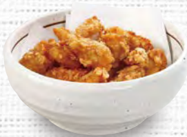
鶏軟骨唐揚げ 390(税込429)