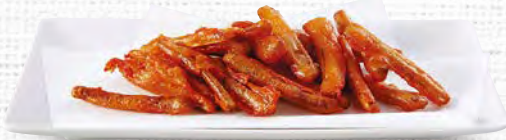
ごぼうの唐揚げ 300(税込330)