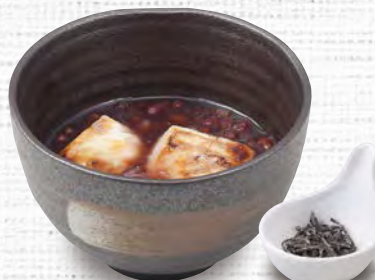
ぜんざい 480(税込528) (もち2ヶ入り)