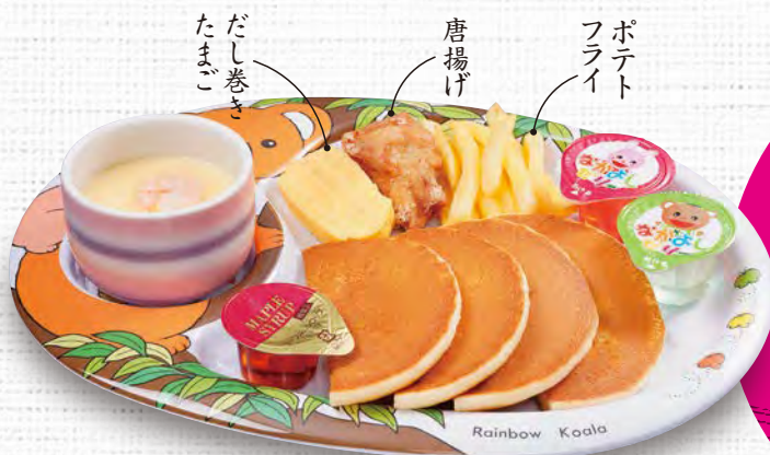
おこさまパンケーキ 680(税込748)