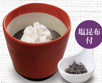
黒ごまプリン 280(税込308)