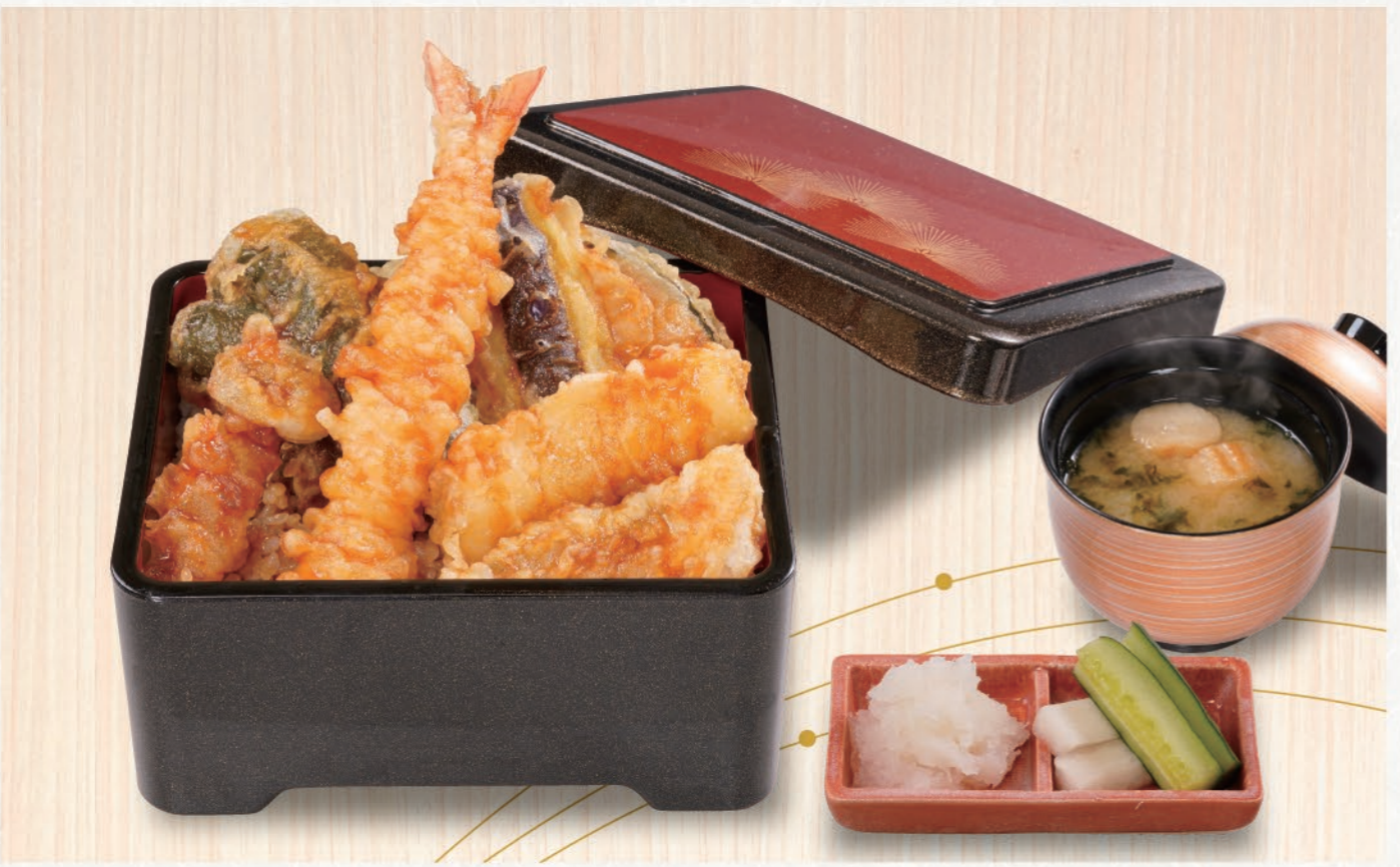
0101 天重 1,280 (税込1,408) 大海老、白身魚、いか、野菜4種