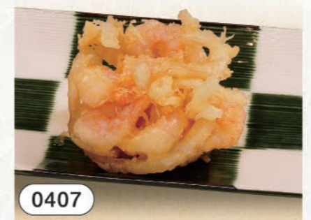
0407 小エビのかき揚げ 380 (税込418)