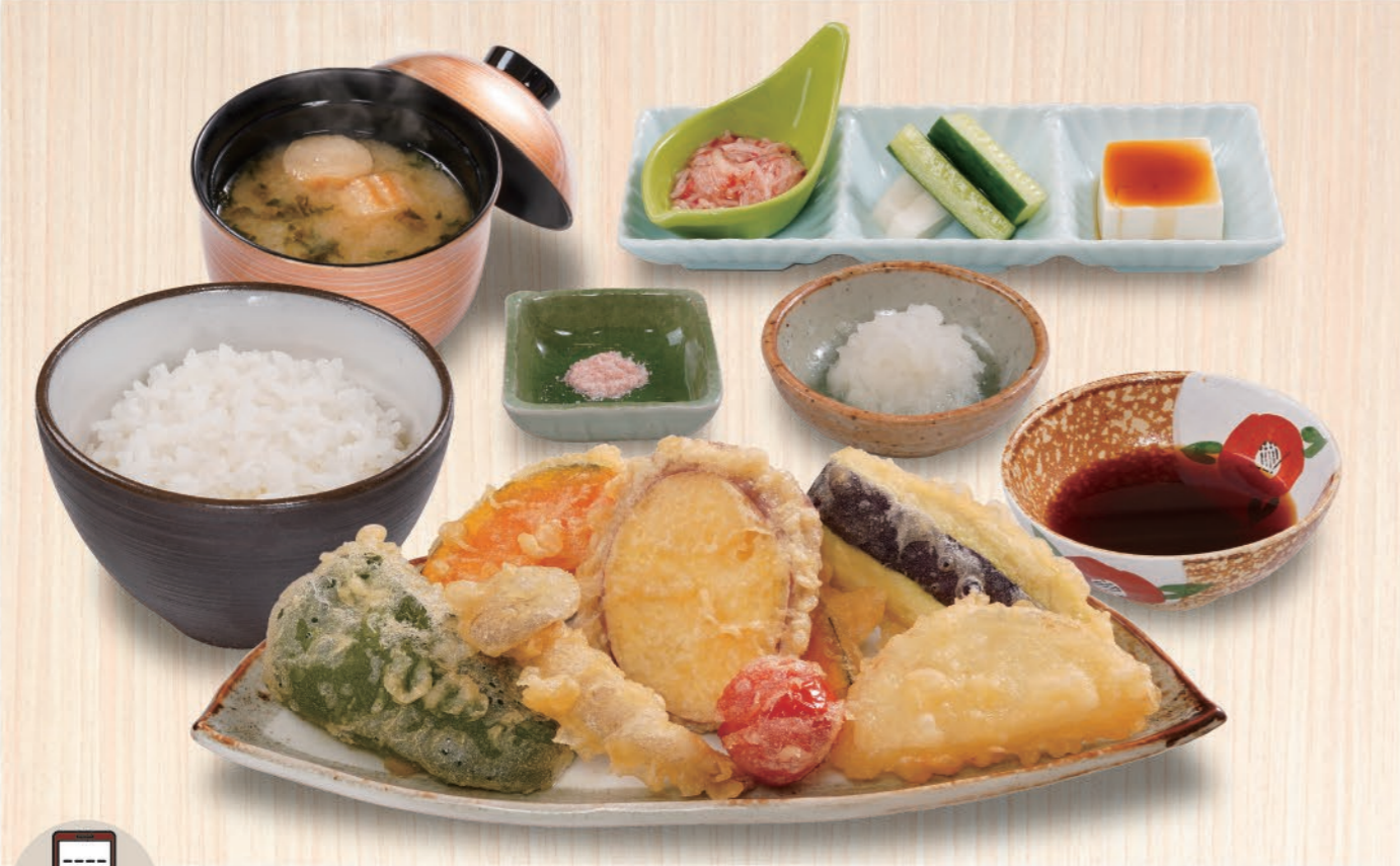
0007 彩り野菜天定食 1,180 (税込1,298) しめじ、さつまいも、茄子、ピーマン、玉ねぎ、トマト、南瓜 ※天ぷらの野菜は季節によって変わる場合がございます。