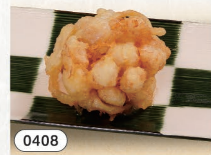
0408 小柱のかき揚げ 480 (税込528)