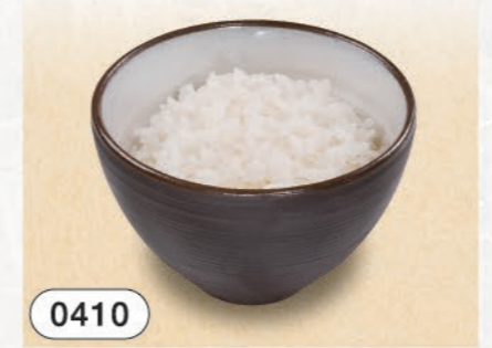
0410 ごはん 大盛り無料です。 200 (税込220)