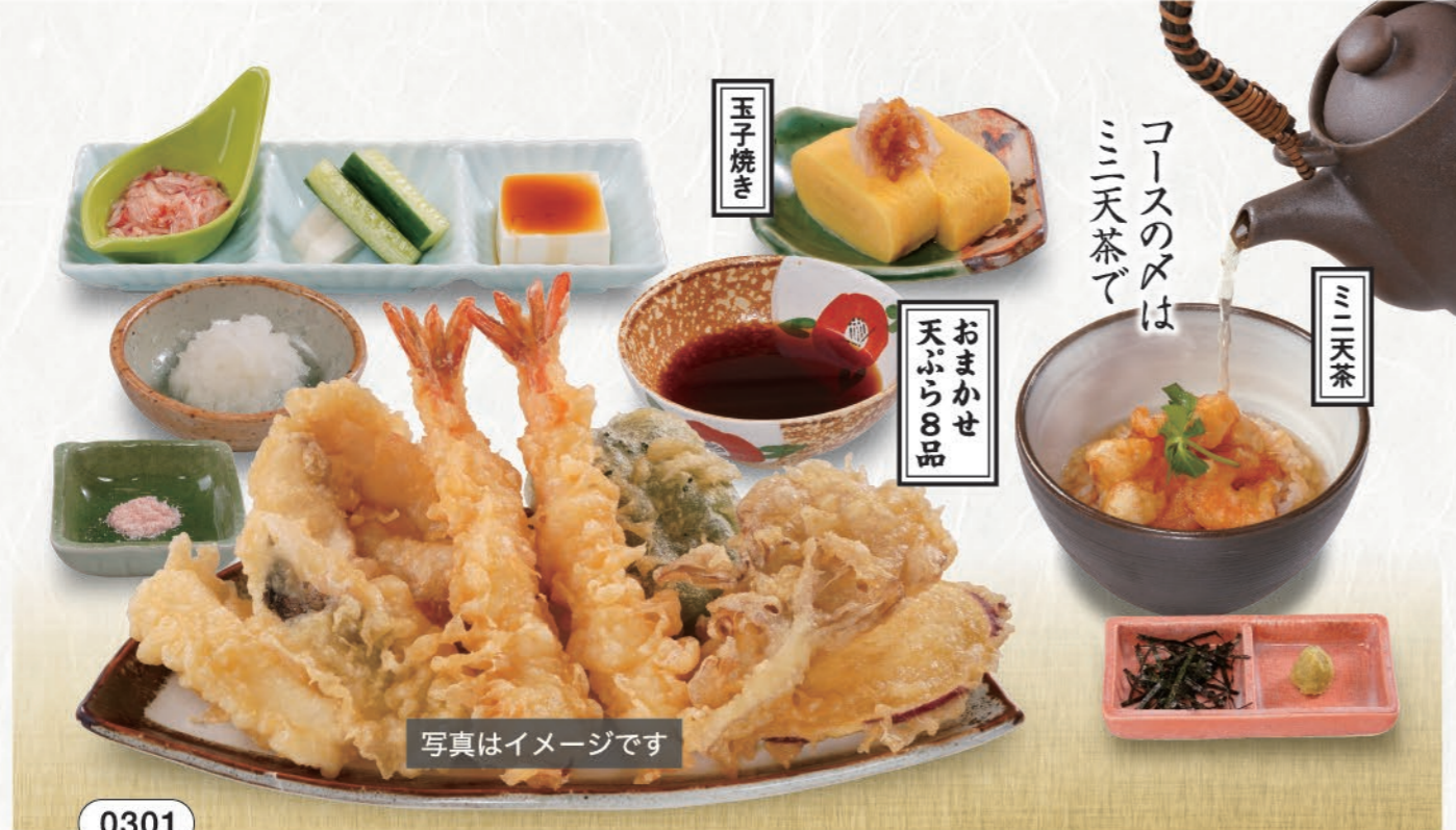
0301 おまかせコース【松】 1,800 (税込1,980) おまかせ天ぷら8品にミニ天茶と玉子焼きがセットのおすすめコースです。 ※天ぷらの内容は日によって変わります。

こだわり天ぷら8品をメインに、お酒との調和が楽しめるコース。最後はミニ天茶でほっとする余韻を。