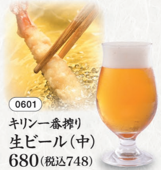
0601 キリン一番搾り 生ビール(中) 680 (税込748)

●20歳未満の方の飲酒は法律により禁じられています。 ●お車の運転をされる方の飲酒はお断りします。