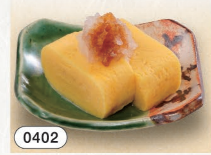
0402 玉子焼き 280 (税込308)