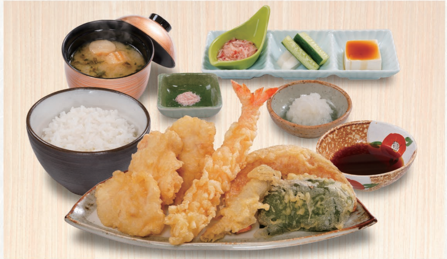
0005 鶏と海老天定食 1,280(税込1,408) とり×3、大海老、野菜3種