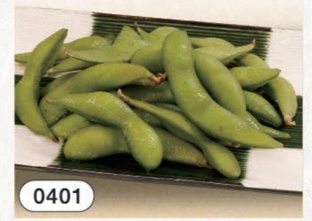
0401 枝豆 180 (税込198)