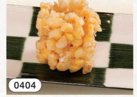
0404 スイートコーンかき揚げ 280 (税込308)