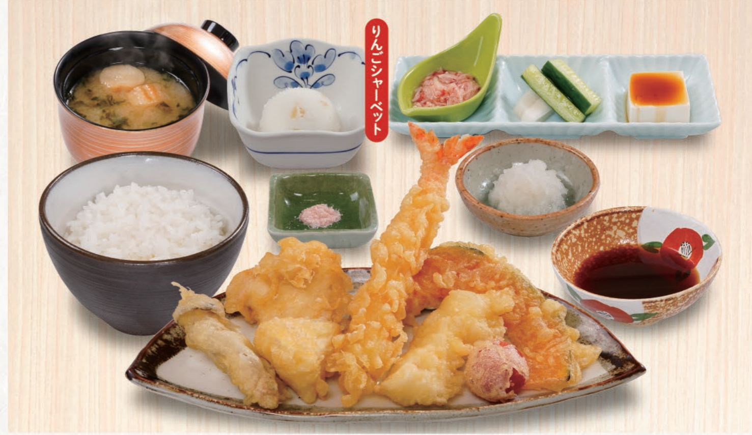
0008 レディースセット 1,580 (税込1,738) 大海老、とり、いか、カマンベールチーズ、野菜3種