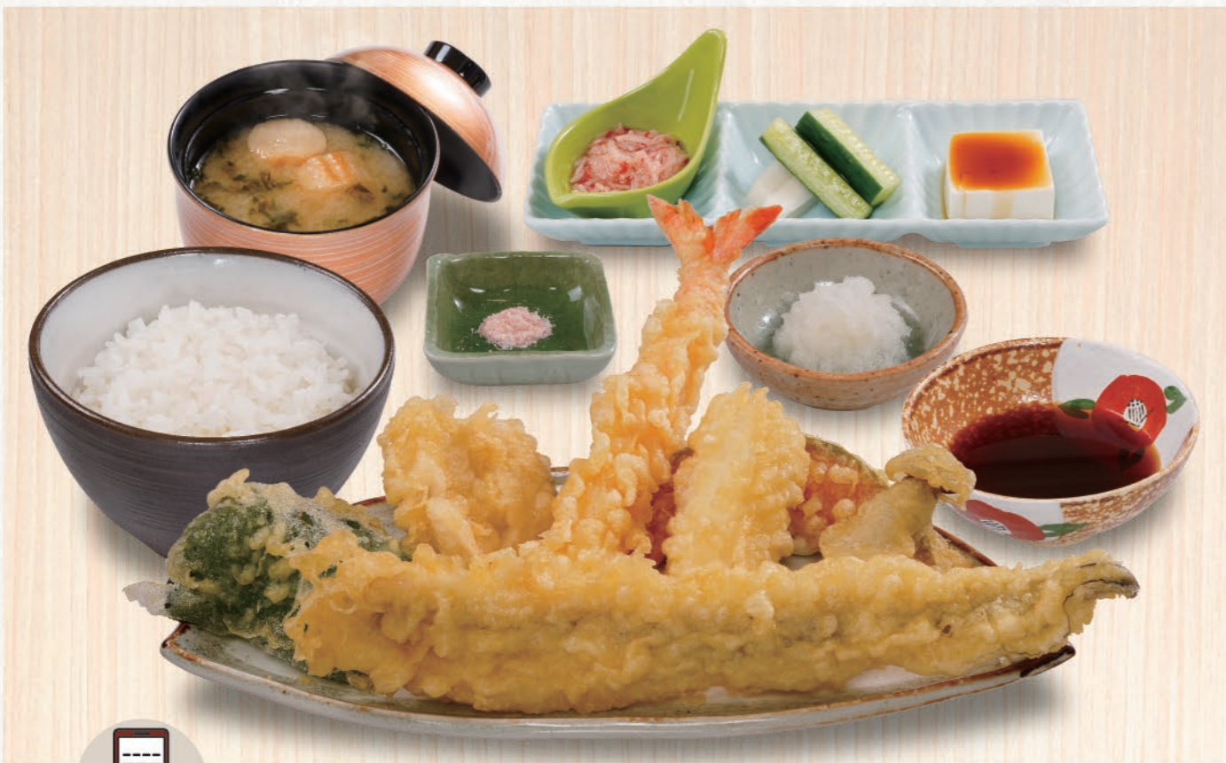
0003 特上定食 1,680(税込1,848) 穴子、大海老、とり、いか、野菜3種