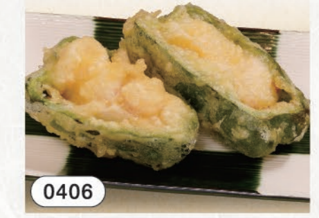
0406 とりピーマン天 380 (税込418)