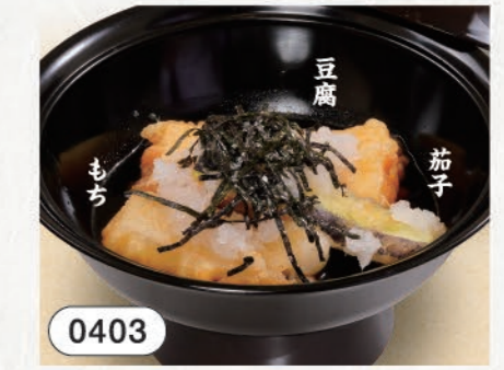
0403 揚げだし盛合せ 480 (税込528)