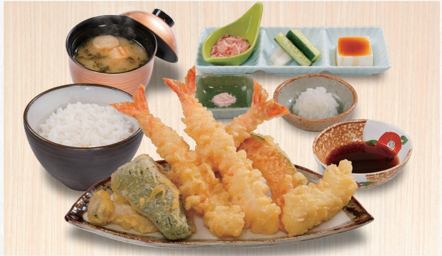
0004 海老天定食 1,580(税込1,738) 大海老×3、いか、野菜3種