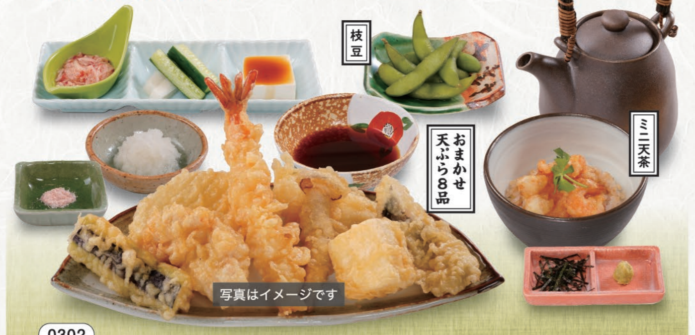
0302 おまかせコース【竹】 1,600 (税込1,760) おまかせ天ぷら8品にミニ天茶と枝豆がセットのおすすめコースです。 ※天ぷらの内容は日によって変わります。