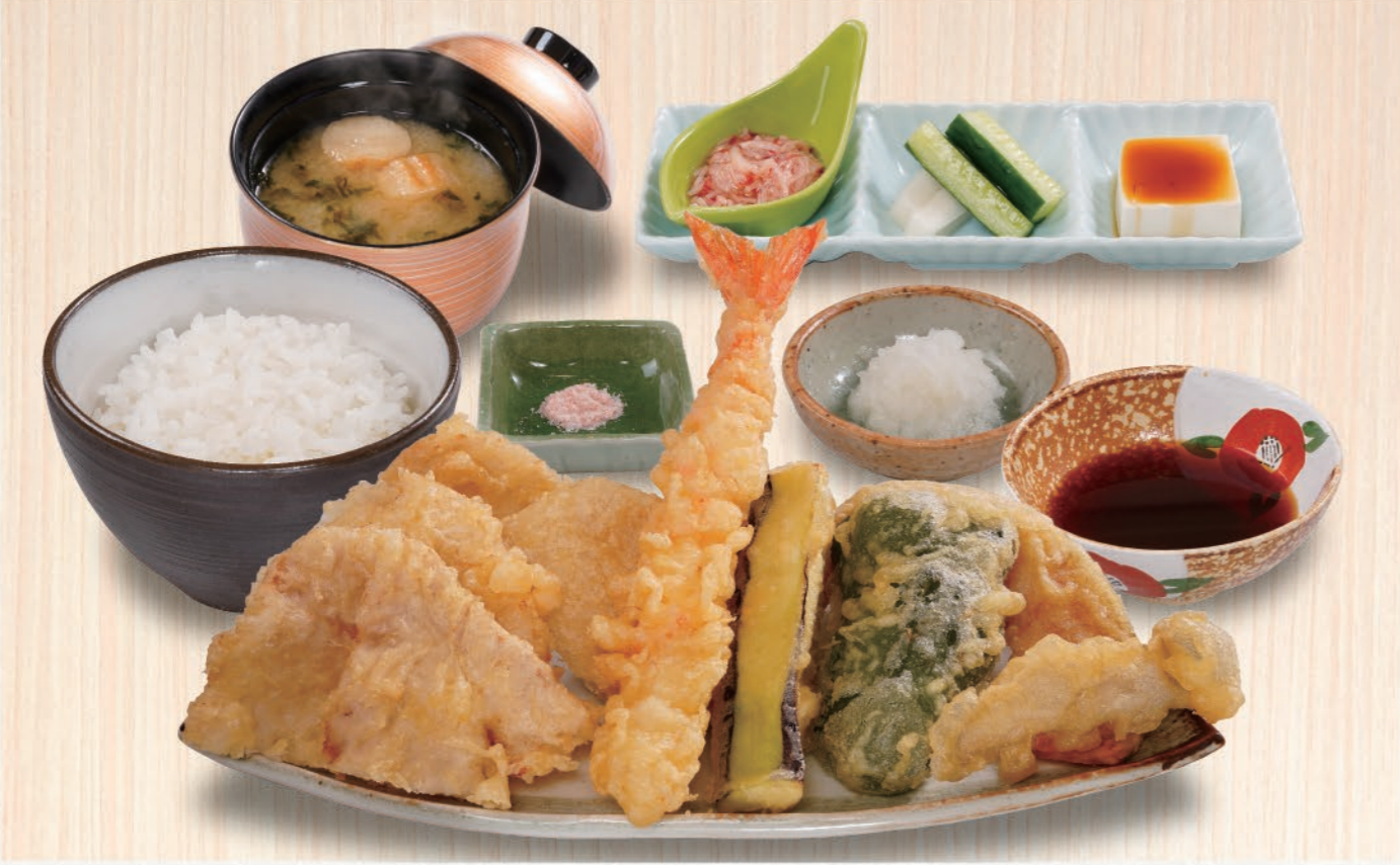
0006 豚と海老天定食 1,580 (税込1,738) 豚ロース×4、大海老、野菜4種