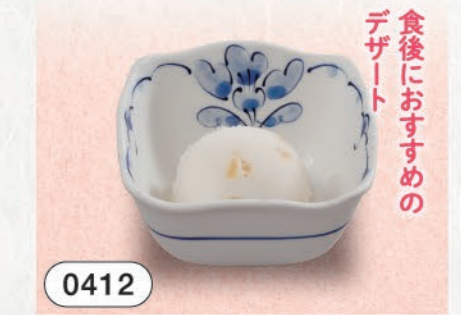
0412 りんごシャーベット 150 (税込165)