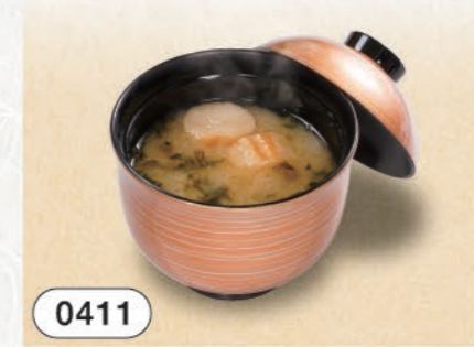
0411 みそ汁 150 (税込165)