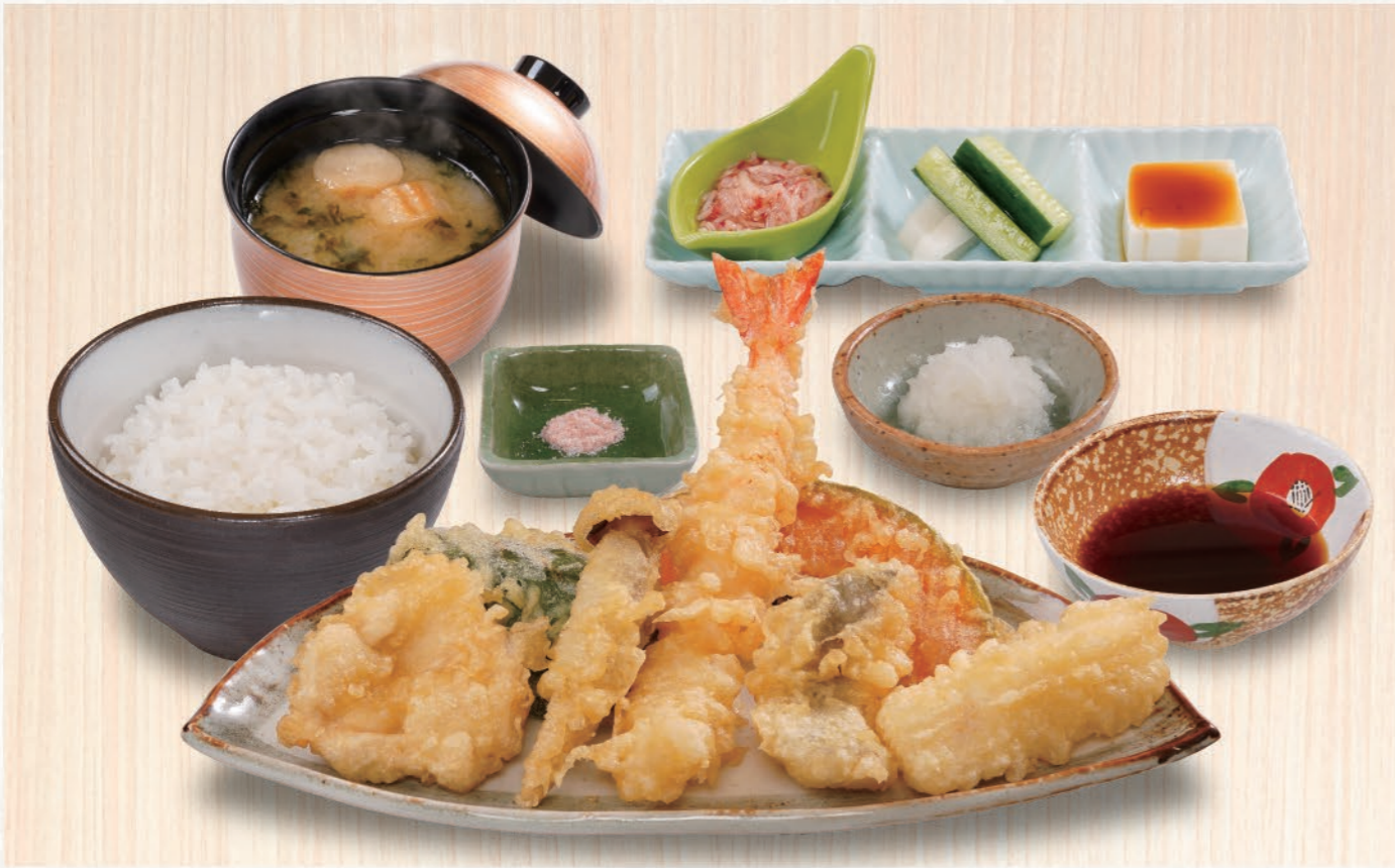
0002 那かむら定食 1,280(税込1,408) 大海老、白身魚、とり、いか、野菜3種