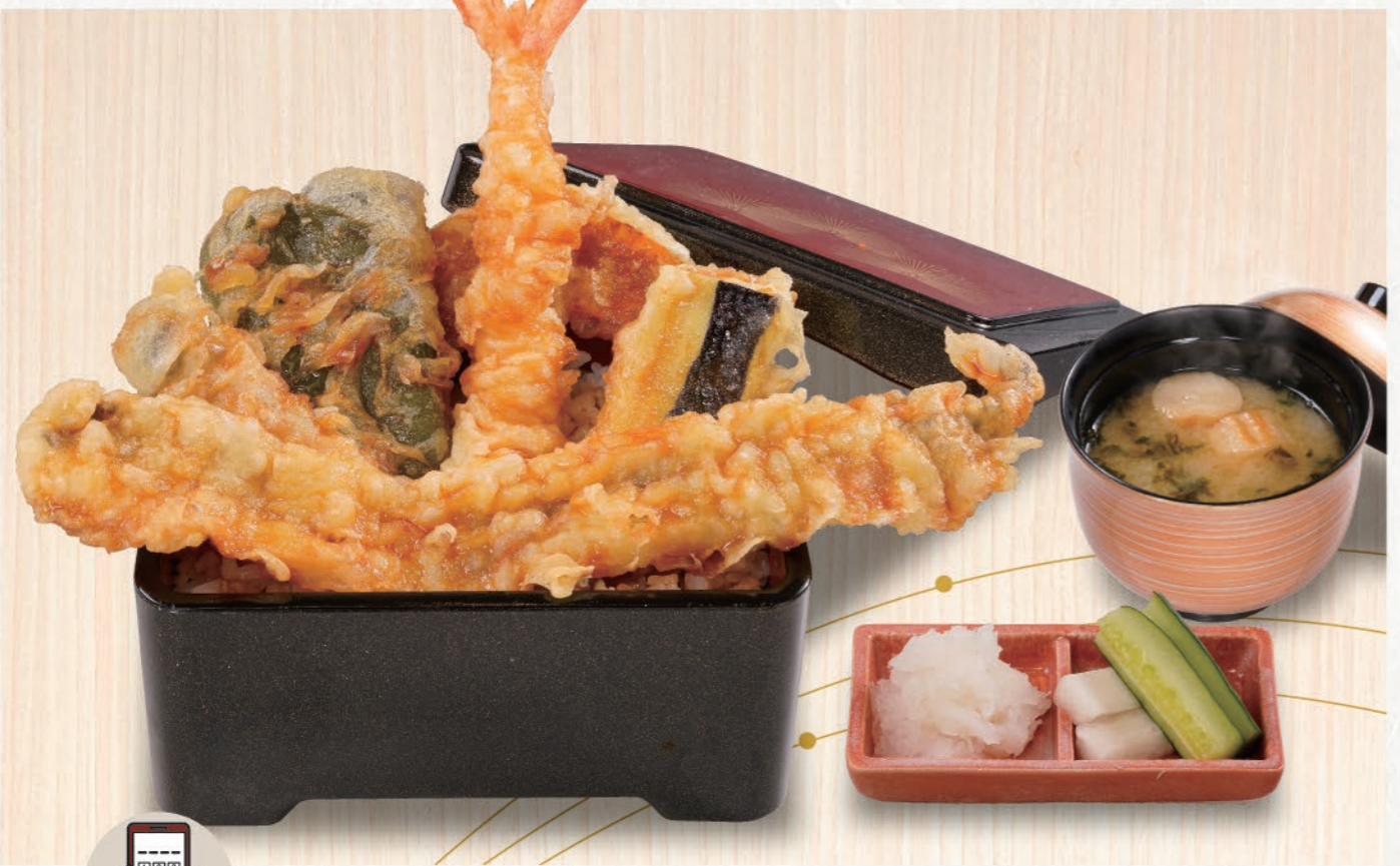
0102 特上天重 1,580 (税込1,738) 穴子、大海老、野菜4種