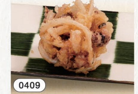
0409 タコのかき揚げ 480 (税込528)