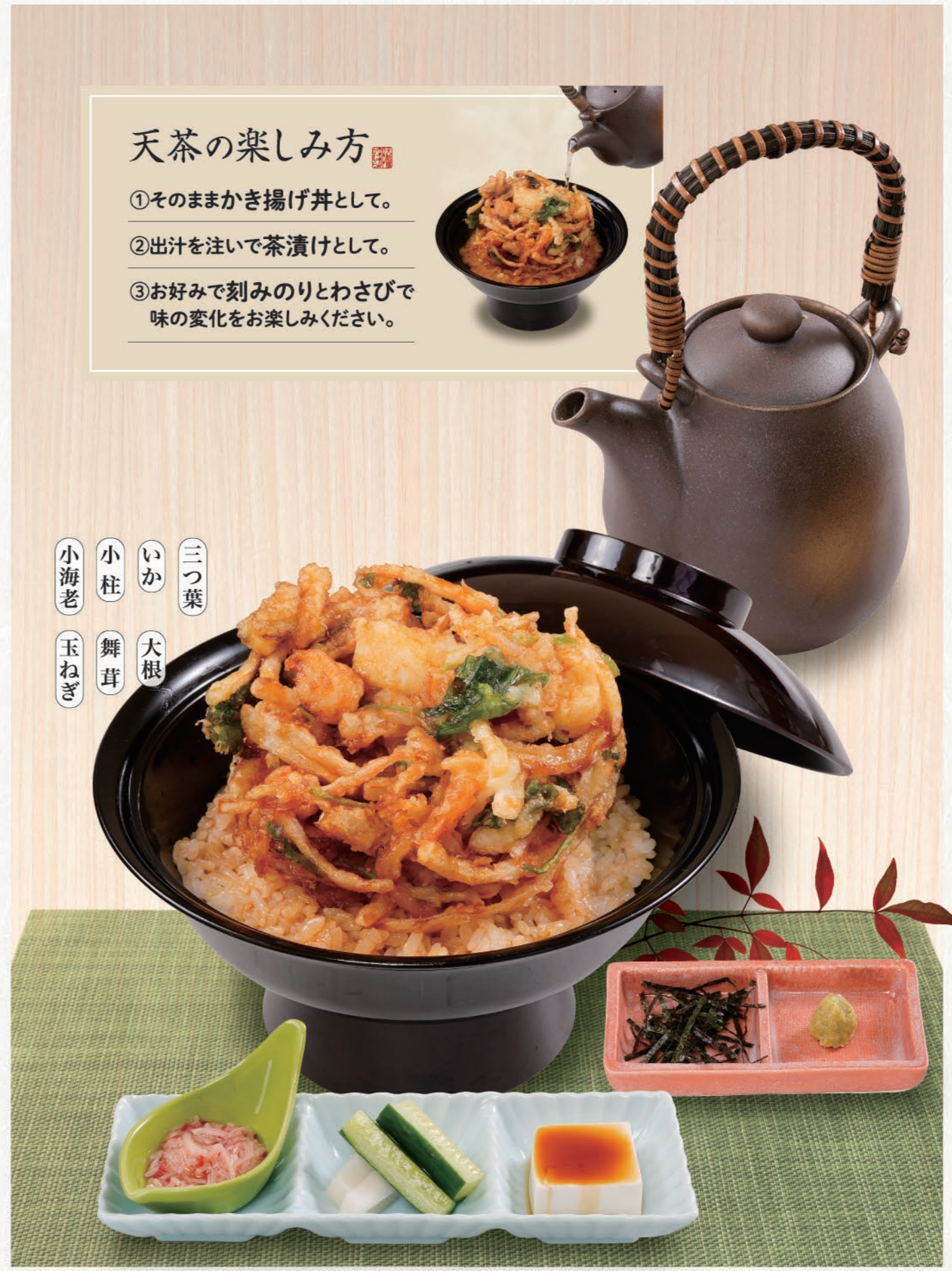
0201 天茶 1,480 (税込1,628)