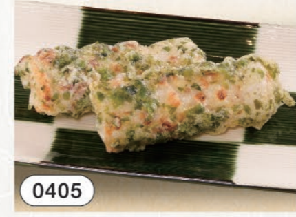
0405 ちくわ磯辺天 280 (税込308)