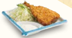
おつまみアジフライ 430(税込473)