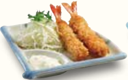
おつまみエビフライ 480(税込528)