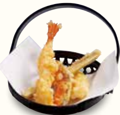
ちょっと天ぷら 480(税込528)