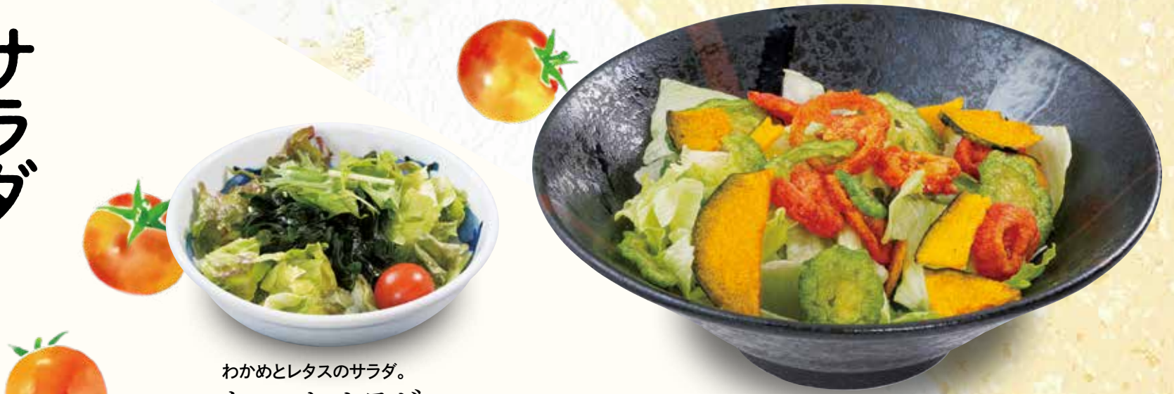
わかめとレタスのサラダ。 ちょっとサラダ 280(税込308)