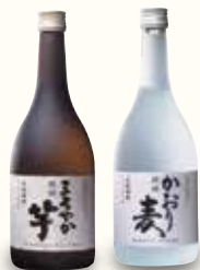
焼酎(芋・麦) (グラス)各380(税込418)