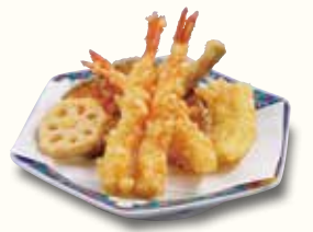
天ぷら盛り合わせ 880(税込968)