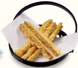
ごぼうの天ぷら 380(税込418)