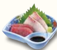
ちょっと刺身 430(税込473)