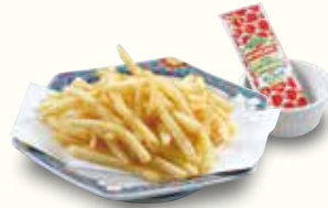
フライドポテト 380(税込418)