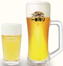
キリン 一番搾り生ビール (中)630(税込693) (グラス)430(税込473)