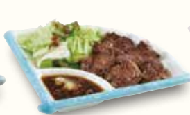
ちょっとステーキ 530(税込583)