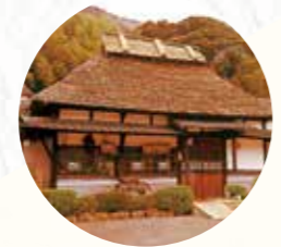
庄屋本店(長崎県江迎町)

庄屋の歴史は、一九七(昭和四六年)、長崎の小さな町に生まれた一軒の食堂から始まります。昭和時代の小さな創業から受け継ぐ、和食の「こころ」とは、おもてなしやお料理に、今も活かされています。