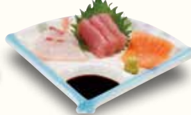
お刺身三品盛り 980(税込1,078)